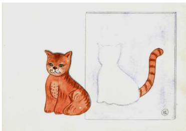
Tekening “kat zonder staart” in hoofdstuk 2: Jeanne de Gooijer