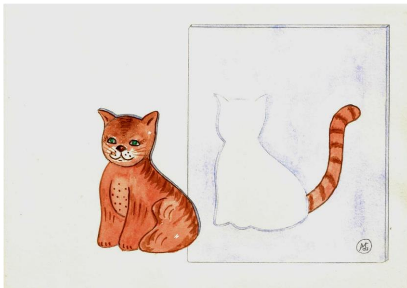
Figuur 1. Kinderen met NLD kunnen per ongeluk een kat uitknippen zonder de staart mee te nemen. Zij zien dit gewoon niet.

Kleuterschool. Op de kleuterschool lopen zij tegen allerlei dingen aan zoals het niet goed kunnen zien en uitvoeren van knip- en plakwerkjes. Ik laat een voorbeeld zien van een kleuter met NLD die de opdracht krijgt om een papieren kat uit te knippen. Als de kleuter de opdracht af heeft blijkt dat de staart niet is uitgeknipt. De juf vindt dat hij beter moet kijken bij wat hij doet en de klasgenootjes zeggen dat zij dit wel dom vinden. Wat doet dit met (het ontwikkelen van) de eigenwaarde van een kind?