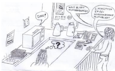
Tekening “werken in de kantine” op voorblad: Gerrit Muller